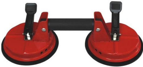
6" Sauger aus Stahl Tragkraft bis 135KG