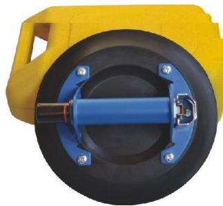
Griff aus Metall, flache Saugscheibe * 8" Tragkraft 58KG * 9" Tragkraft 68KG