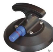
weiche konkave Saugscheibe