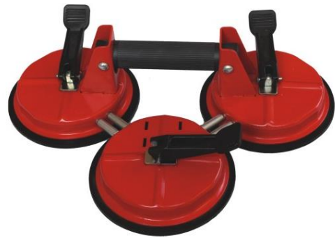
6" Sauger aus Stahl Tragkraft bis 210KG

mit Schnellverschluss, gut an raue Fliesen bis 0,5mm