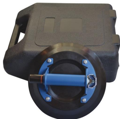
Griff aus Metall *10" Tragkraft 80KG