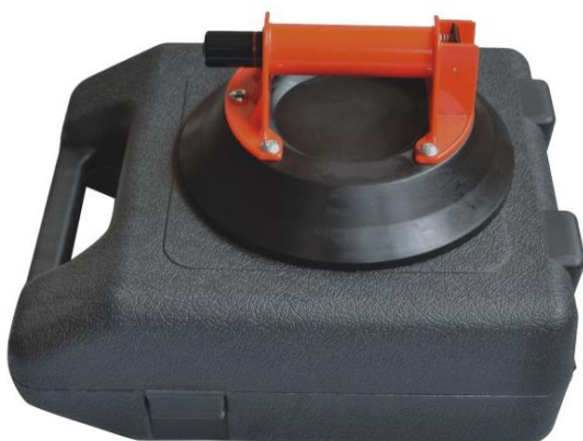
Griff aus ABS * 10" Tragkraft 80KG