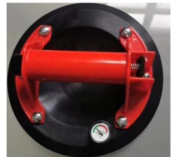
lieferbar mit Manometer