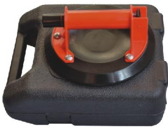
Griff aus ABS, flache Saugscheibe * 8" Tragkraft 58KG * 9" Tragkraft 68KG